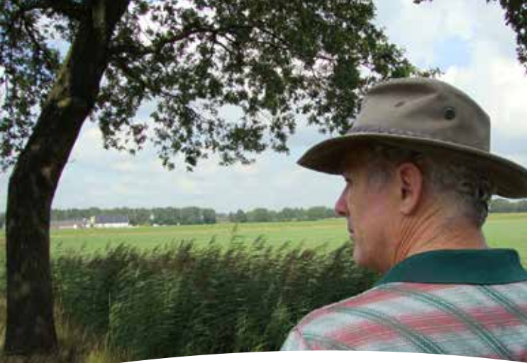
De Peel vandaag