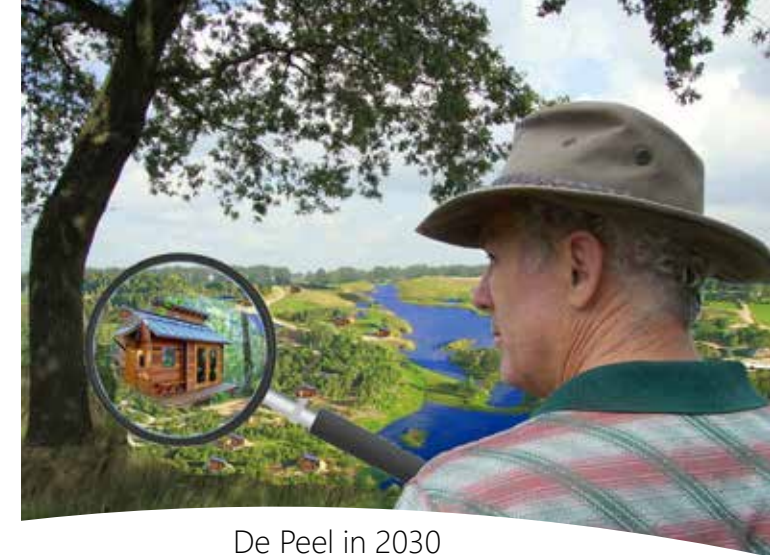
De Peel in 2030

De Peel met haar rijke historie en roemrucht verleden gaat herleven tot een weldaad voor heel de regio